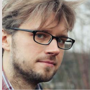
JUSTAS INGELEVIČIUS architektas, atviro kodo programos „Blender“ vystytojas